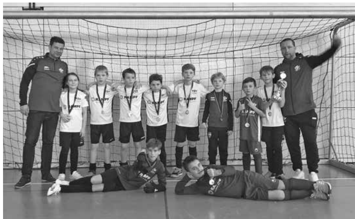
Beim Abpfiff stand es 2:1 gegen Gastgeber Grötzingen und die E-Junioren freuten sich über ihren Bronze-Erfolg.

Angefangen hatte diese für die zeitweise zwei Mannschaften schon am 7. Januar mit dem Hallencup der Sportfreunde in Rommelsbach. Ein vierter Platz zum warm werden – nicht schlecht. Aber eines war klar: Das geht noch besser! Und schon beim Alpha-Sport Cup in Sindelfingen nur sechs Tage später zeigten die Junioren von der Buckenwiese, was sie tatsächlich drauf haben. Ehrgeiz, Disziplin und Hingabe sind seit jeher DAS Erfolgsrezept für einen Platz auf dem Siegereckchen. Turnier-Zweiter! Großartig. Und das war ja erst der Anfang. Beim TSV Raidwangen am 28. Januar war ein wenig die Luft raus, eine Woche später in Mittelstadt hatten sich die jungen Kicker*innen dann erneut auf ihre Stärken besonnen. Dafür wurden sie prompt wieder mit Silber belohnt. Prima! Das Fazit: Dreimal Silber, einmal Bronze für die insgesamt 22 Teilnehmer*innen aus Grafenberg – ein Ergebnis, das sich sehen lassen kann. Jetzt freut sich die E-Jugend auf ihre neuen Herausforderungen, die im Ligabetrieb draußen auf dem Rasen auf sie warten. Eines jedoch steht fürs Trainerteam schon jetzt fest: Mit ihren tollen Kindern, die mit so viel Biss, Leidenschaft und Herz dabei sind, kann eigentlich gar nichts schief gehen! Denn nichts macht mehr Spaß, als zuzusehen, wie auch die junge Generation am gemeinsamen sportlichen Erfolg in Grafenberg teilhaben will.