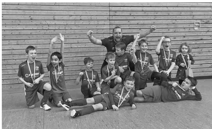
Ein großartiger zweiter Platz setzte also das letzte Ausrufezeichen, mit dem die TSV E-Jugend ihre Hallensaison beendete.