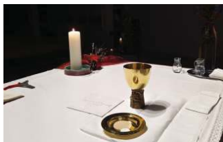
Abendmahlfeier am Gründonnerstag