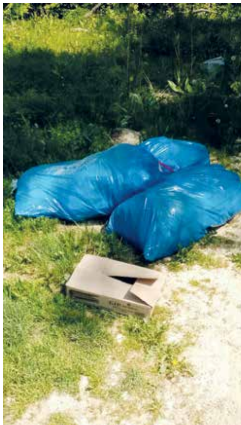
...sowie Müllsäcke und Kartons im Wald auf Grafenberger Gemarkung illegal entsorgt.