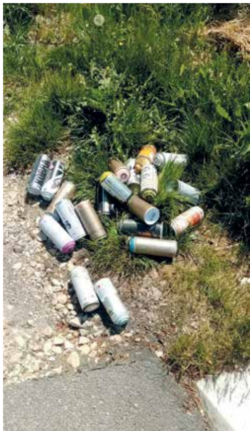
Vor kurzem wurden Getränkedosen...