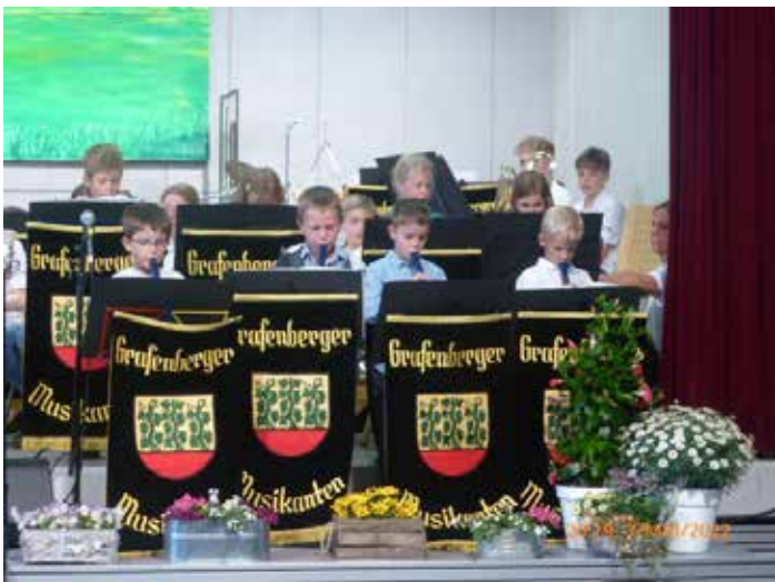
Die Blockflötenklasse der Grundschule...