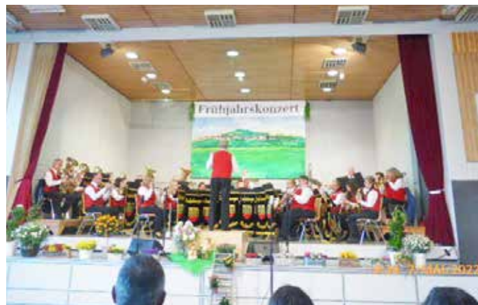
Die "Grafenberger Musikanten" luden zum Frühjahrskonzert