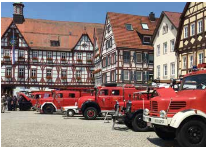
Feuerwehr-Oldtimer auf dem Bad Uracher Marktplatz