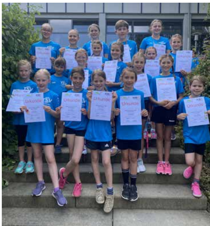
Unsere erfolgreichen Teilnehmer/innen