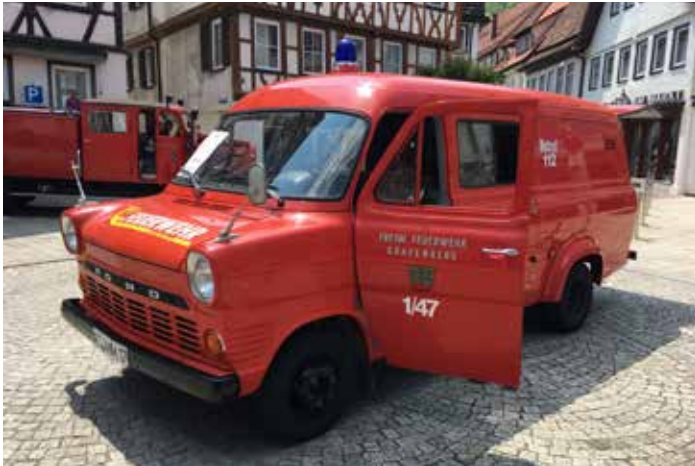
Oldtimer der Feuerwehr Grafenberg - Ford Transit Baujahr 1966, im Dienst bis 1999

100 Jahre Kraftspritze (KS) 20 feierten die Kameraden aus Bad Urach am vergangenen Sonntag mit einem Tag der offenen Türe. Zu Ehren des historischen Fahrzeuges fand auf dem Marktplatz bei herrlichem Wetter auch eine Oldtimerausstellung mit ca. 50 weiteren alten Feuerwehrfahrzeugen statt, in deren Rahmen auch wir unseren Oldtimer Ford Transit Baujahr 1966, im Dienst bis 1999, präsentieren durften.