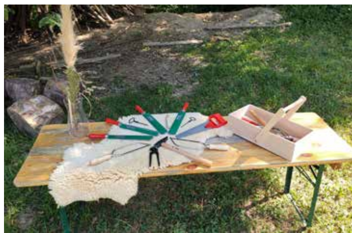
...und das neue Holzwerkzeug.