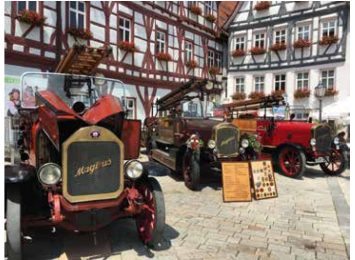
Ganz alte Fahrzeuge mit dem Jubilar KS 20 in der Mitte