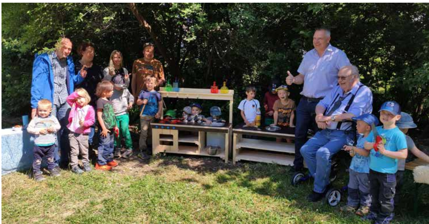
Bei der Übergabe herrschte große Freude bei Groß und Klein.