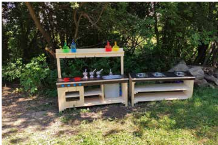
Die neue Matschküche