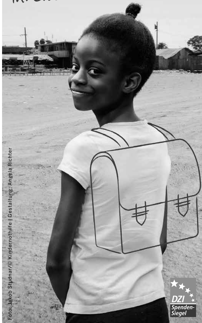
Gestaltung: Angela Richter