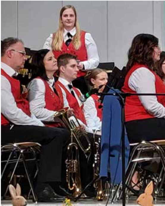
Unsere Moderatorinnen Michelle ...