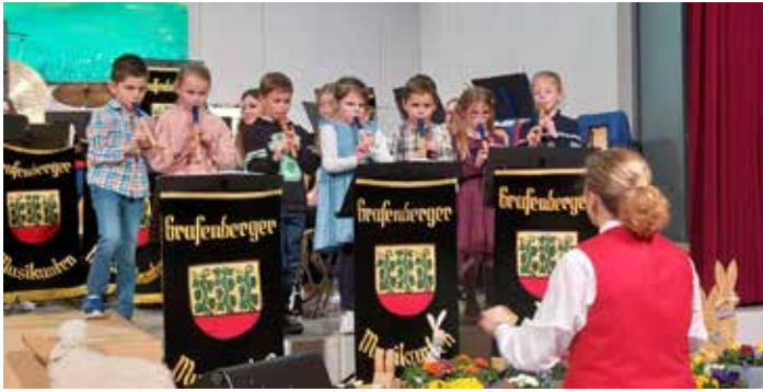
Die Blockflötenklasse der Grundschule - einfach herrlich!