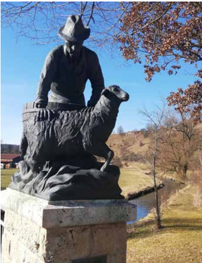
Viele Grüße Sabine

Doch sind wir optimistisch und freuen uns auf einen schönen, abwechslungsreichen Wandertag bei hoffentlich schönem Frühlingwetter.