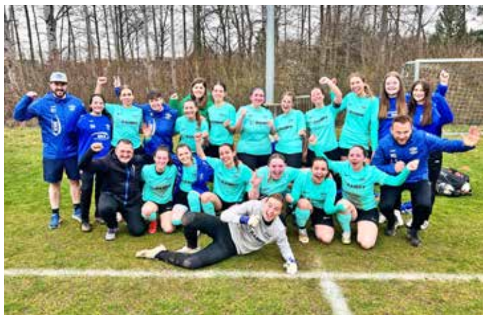
Siegerbild