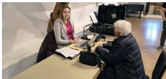
Frau Dalipi mit einer Bürgerin in der Kelter

Eine Teilnahme ist nur nach vorheriger Terminvereinbarung möglich. Termine können telefonisch oder per E-Mail über das Rathaus vereinbart werden.