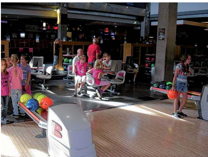
Auf drei Bahnen wurde gebowlt