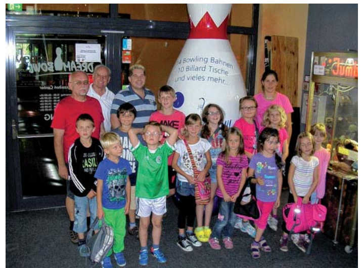
Zum Schluss noch ein Gruppenfoto der gesamten Mannschaft