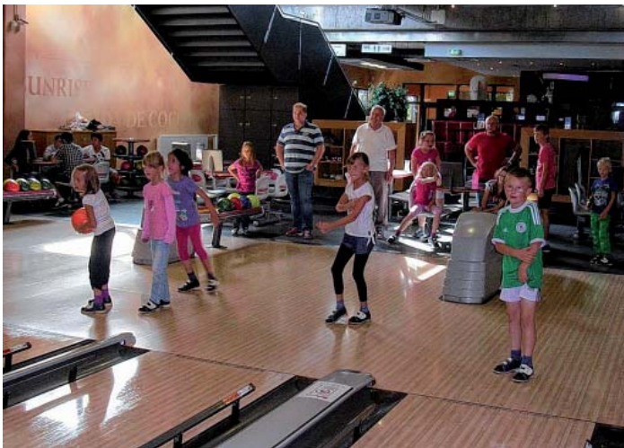
Auf der Bowlingbahn versucht jeder sein Bestes zu geben.

"Strike" hieß es einmal mehr beim diesjährigen Sommerferienprogramm des Gesangverein "Liederkrantz 1877" Grafenberg am vergangenen Donnerstag, dem 28. August. Mit 13 Kindern und 4 Betreuer und Betreuerinnen ging es zum Bowlingzentrum "Dream Bowl" nach Metzingen, wo sich die Ferienkinder und Betreuer 2 Stunden lang beim Bowling spielen auf drei Bahnen vergnügen konnten. Bei der Rückkehr nach Grafenberg warteten vor dem Vereinsschuppen zwei weitere Betreuer, die bereits Würste warm gemacht und Getränke hergerichtet hatten, so dass die Kinder frisch gestärkt den Nachhauseweg antreten konnten.