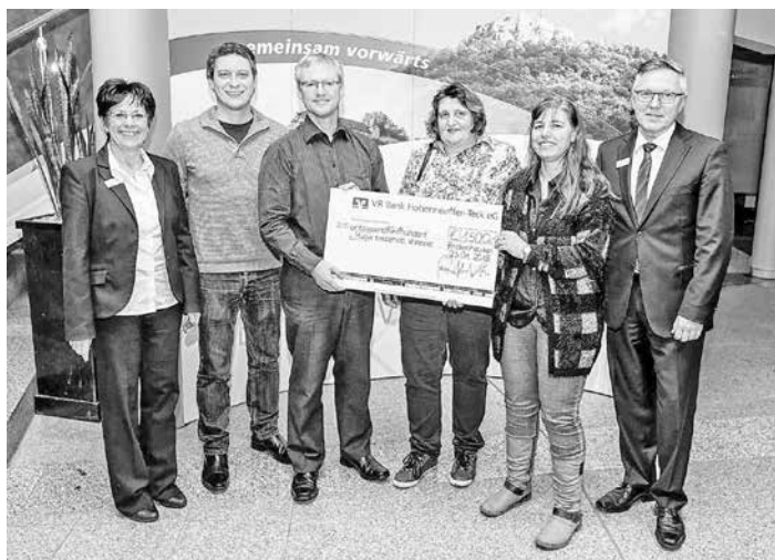
Das Foto zeigt die Verantwortlichen der Vereine, den Vorstand und Mitarbeiter der VR Bank Hohenneuffen-Teck eG bei

Die VR Bank Hohenneuffen-Teck eG konnte im Rahmen ihrer großen Spendenaktion im Dezember 2017 insgesamt 18.500 Euro an 37 musiktreibende Vereine in hrem Geschäftsgebiet überweisen. Auch das Harmonika-Orchester Grafenberg, der Gesangverein Liederkrans Grafenberg und der Musikverein Grafenberg kamen in den Genuss einer Spende. Für diese finanzielle Unterstützung bedanken sich die drei Vereine recht herzlich bei der Volksbank.