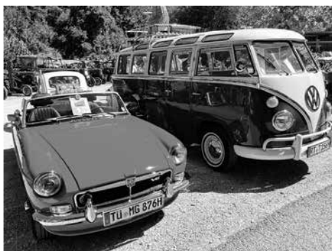
Bild vom Treffen 2018

Am Sonntag, dem 11. August 2019 findet nun bereits schon der 23. Grafenberger Ferienhock