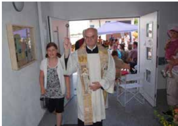
Weihe des Hauses und seiner Räumlichkeiten durch unsere Pfarrer

Bis dieses freudige Einweihungsfest gefeiert werden konnte waren viele Hürden zu nehmen, von freiwilligen Helfern viele Stunden in das Projekt zu investieren und nicht zuletzt Bauhandwerker zu finden, die einige Arbeiten auf ehrenamtlicher Basis erbringen sollten. Aber nun der Reihe nach: