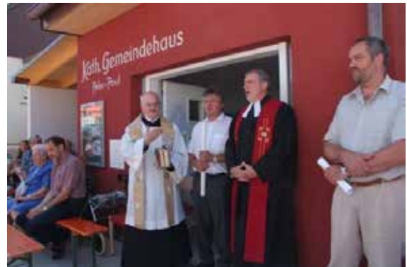
Segenswünsche für das Haus und Bittgebet

schusses der Kath. Kirchengemeinde und Bauleiter), wurde das Haus und die Räume gesegnet und ihrer Bestimmung übergeben. Das Einweihungsfest wurde von vielen Grafenbergern, Metzingern und Riederichern besucht und man war von dem Haus und seinen Möglichkeiten begeistert.