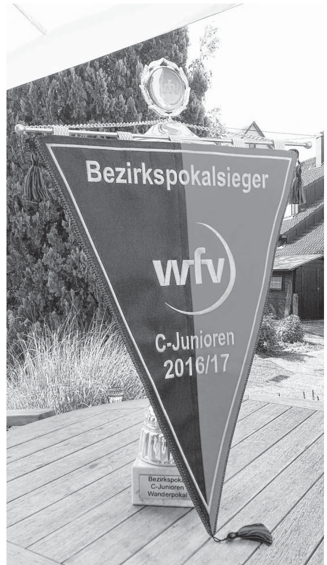
Bezirkspokal und Wimpel